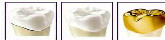
Full porcelain fused to metal Full porcelain crown Full cast alloy crown

Untuk membuat korona, lawatan 2-3 kali diperlukan.